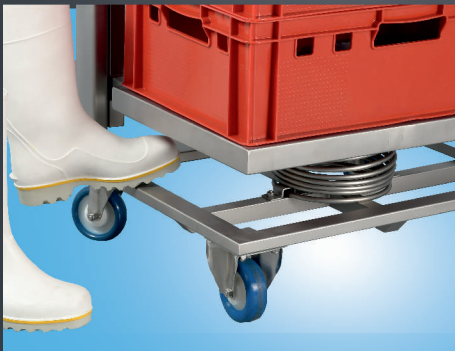
Sicherheitsabstand, dadurch keine Quetschgefahr